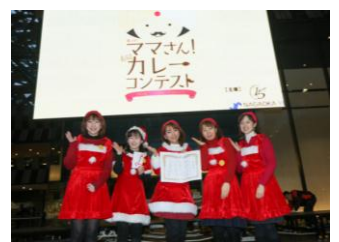
女性会チーム「美ママスマイル」