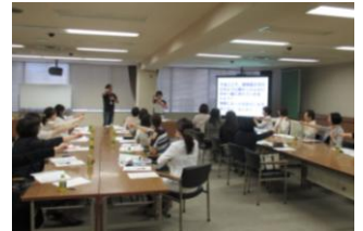
第1回例会：特別講座